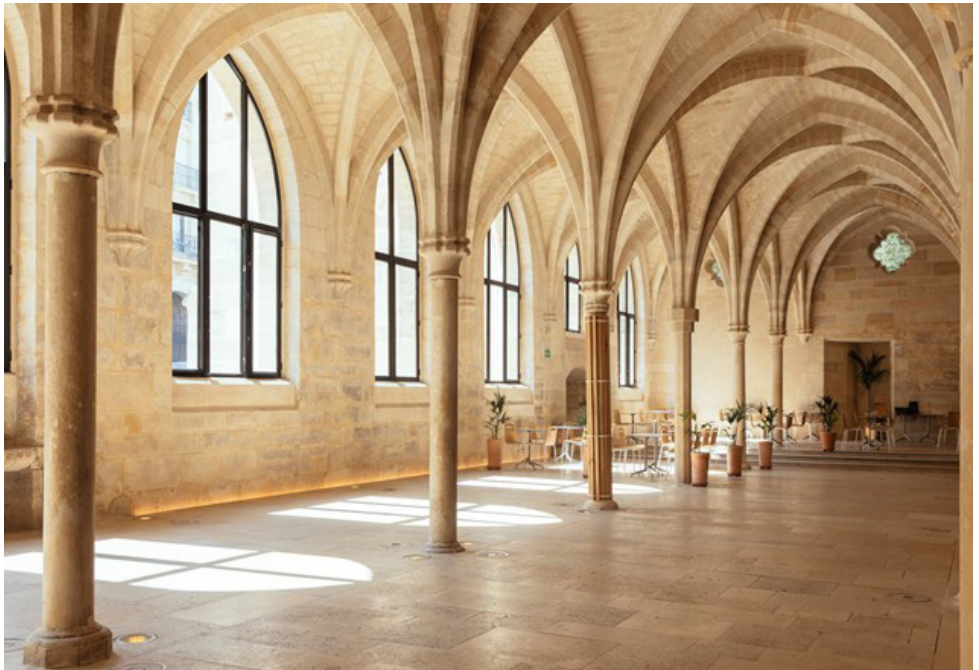
Foto 2, die Halle des Collège des Bernardins.

Der Cardinal Erzbischof von Paris Jean Marie Lustiger erkannte an der regelmäßigen Serie von gotischen Stützpfeilern entlang der Straßenfront den baulichen Wert der Anlage und veranlasste verdienstvollerweise eine grundlegende Sanierung. Man beseitigte die an die Außenwände angelehnten Häuser, die Zwischendecken und die vielen Trennwände in dem Langhaus, und der aufgeschüttete Fußboden wurde auf seine ursprüngliche Tiefe zurückgebaut.