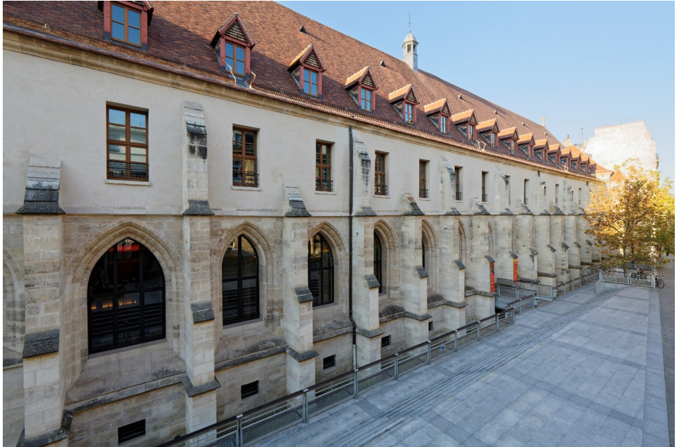
Foto 1, Straßenflanke des Collège des Bernardins, rue de Poissy. Dank an Fanny Le Corre, Collège des Bernardins.

Text und Abrieb Reinhard J. Lamp, Hamburg